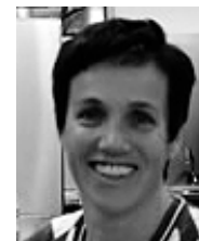
Hedy Immoos Gastronomie

Folgende Strategieziele/Themenkreise verfolgte der Vorstand intensiv, erfolgreich sowie nachhaltig im Sinne und Nutzung der vorhandenen finanziellen Mittel und Personal-Ressourcen: