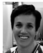
Hedy Immoos Gastronomie

Intensiv sowie nachhaltig im Sinne und Nutzung der vorhandenen finanziellen Mittel und Personal-Ressourcen verfolgte der Vorstand erfolgreich folgende Strategieziele/Themenkreise: